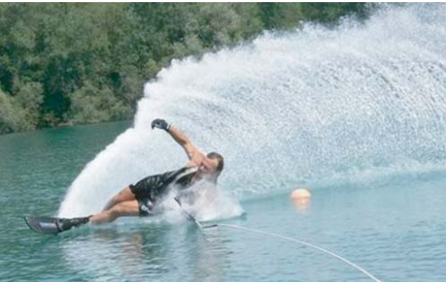
leisure time pleasure water skiing